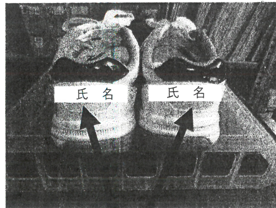
グラウンドシューズ